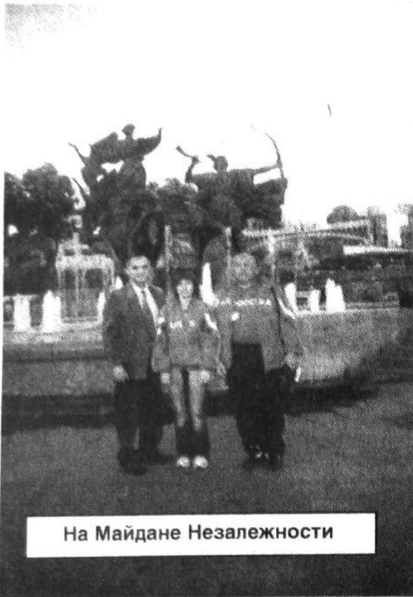
На Майдане Незалежности